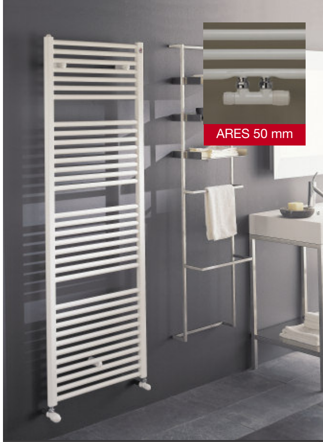
In fotografie: Calorifer Ares. Înălțime mm 1720, lățime 580, culoare Alb Standard (cod. 01).